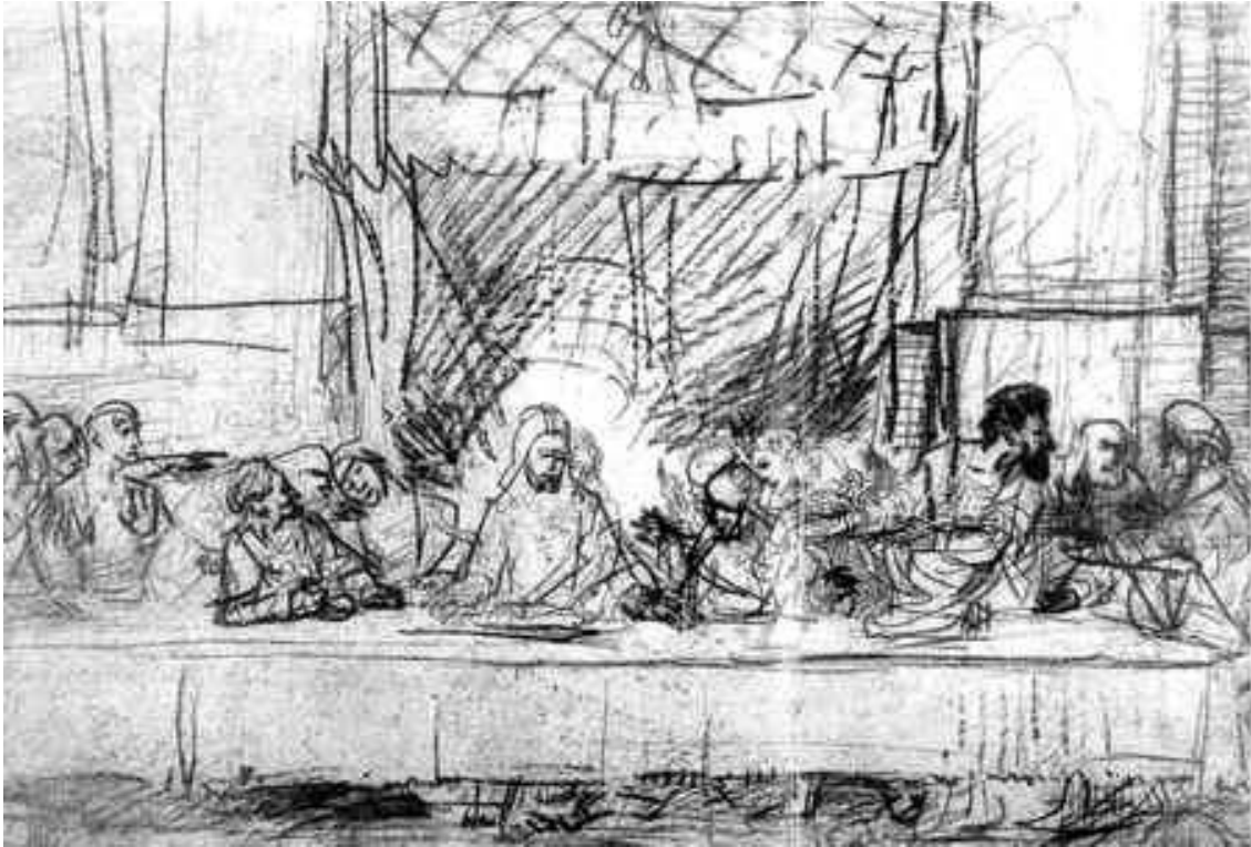
Rembrandt van Rijn, 'Het laatste avondmaal'

Bij binnenkomst van de kerk reinigt iedereen zijn/haar handen. Zo helpt het corona-virus ons te herinneren hoe Jezus aan het begin van de Maaltijd de voeten van zijn discipelen waste.